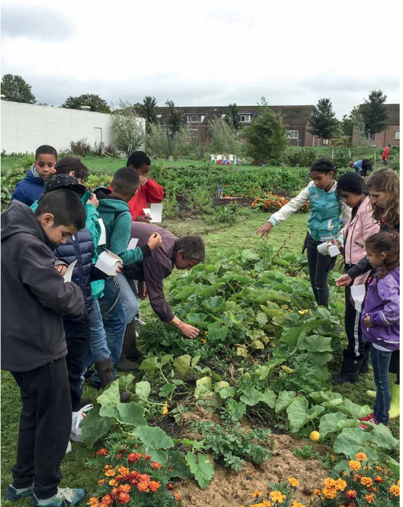
Taka-TukaLand en Taka-TukaTuin worden bewonersvereniging