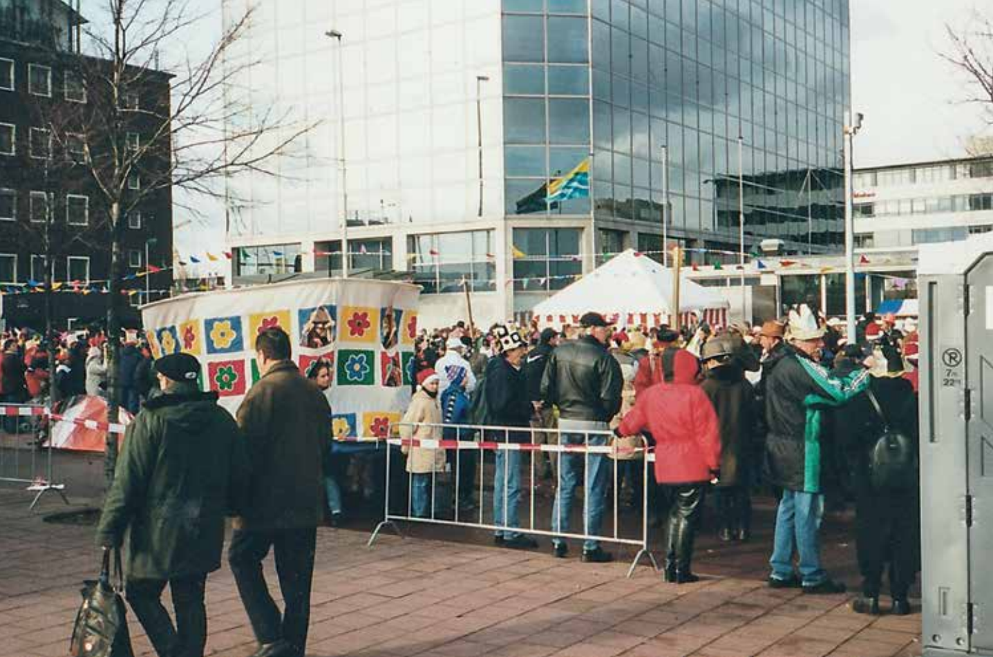
^ Met een enorme Opzomerhoed naar de Coolsingel