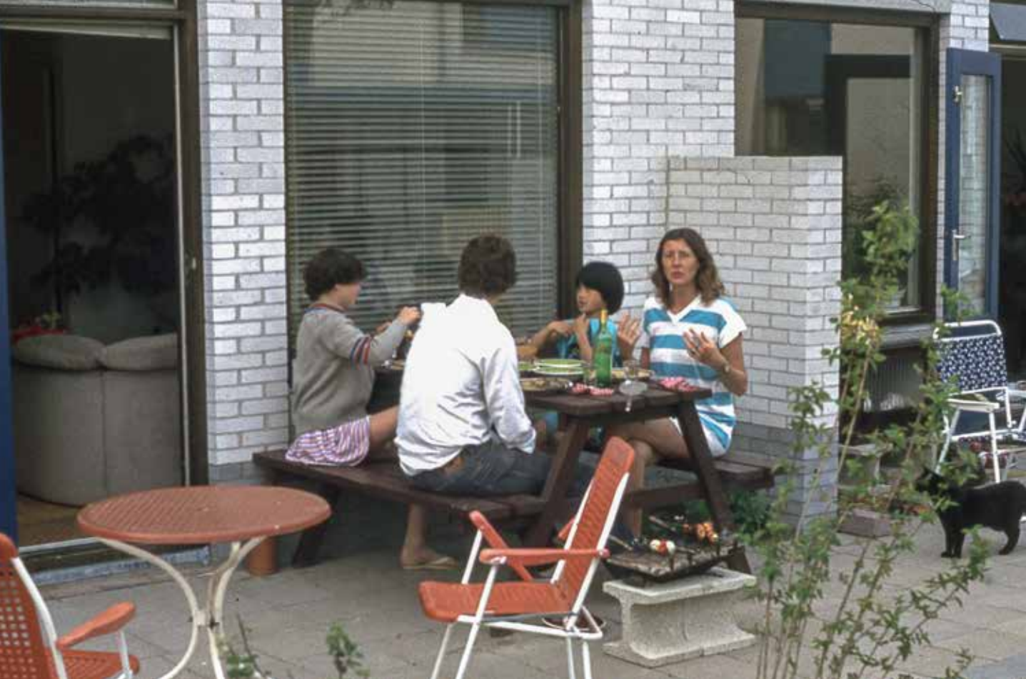
< ^ v De nieuwe bewoners hebben het naar hun zin. Samen doen, wat samen kan