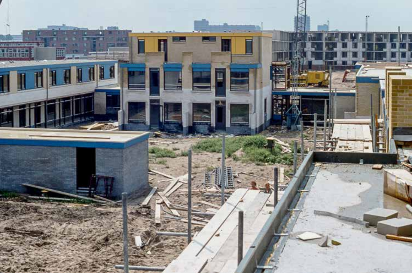
AV Project Centraal Wonen krijgt vorm