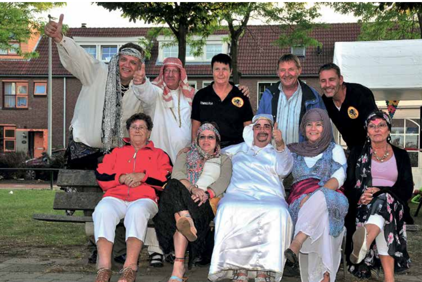
v Opzomereren in de Jazzbuurt