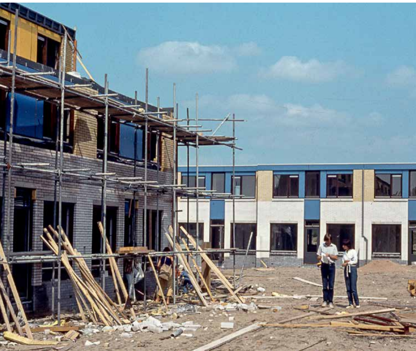
▲ Project Centraal Wonen in uitvoering Het is stevig aanpakken >