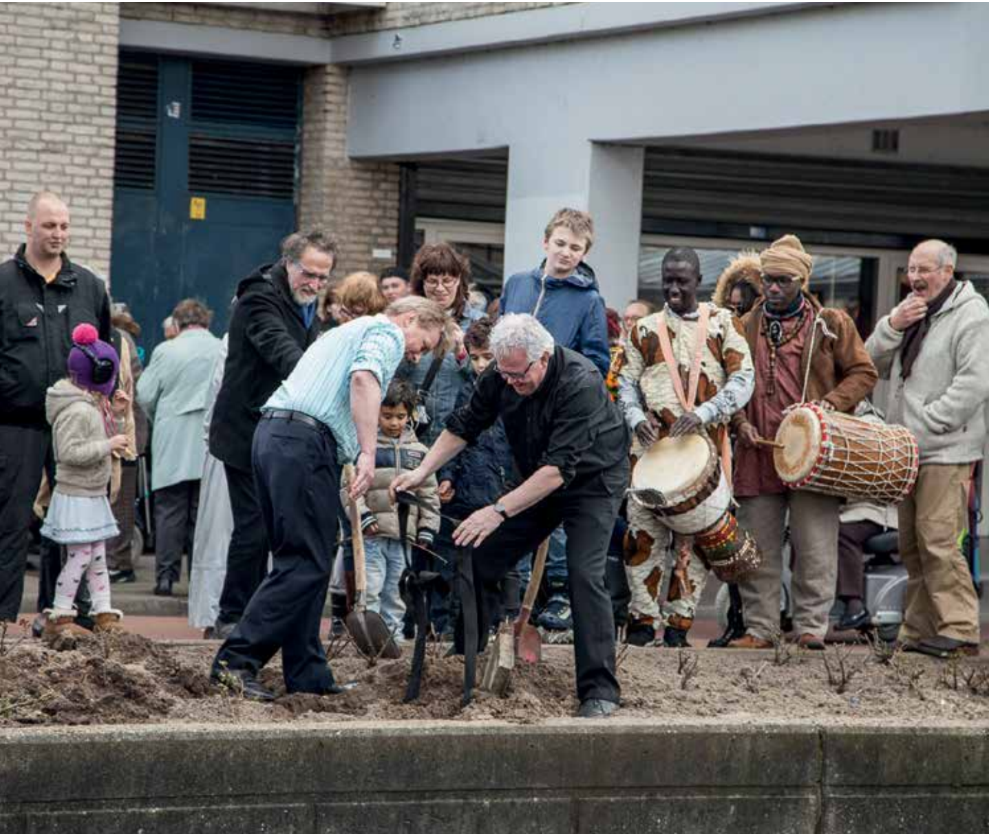
▲ Tijdsapsule wordt opgegraven