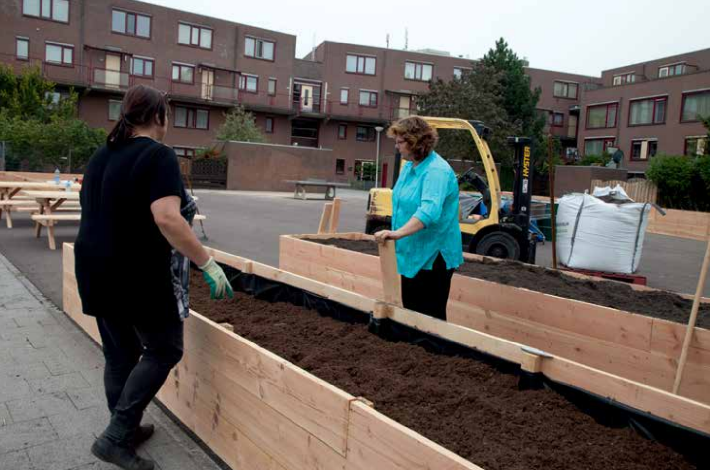
▲ Binnenterrein in Jazzbuurt krijgt tuinderij