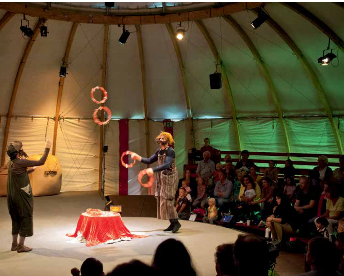
< A Cultuur voor de buurt bij Orion