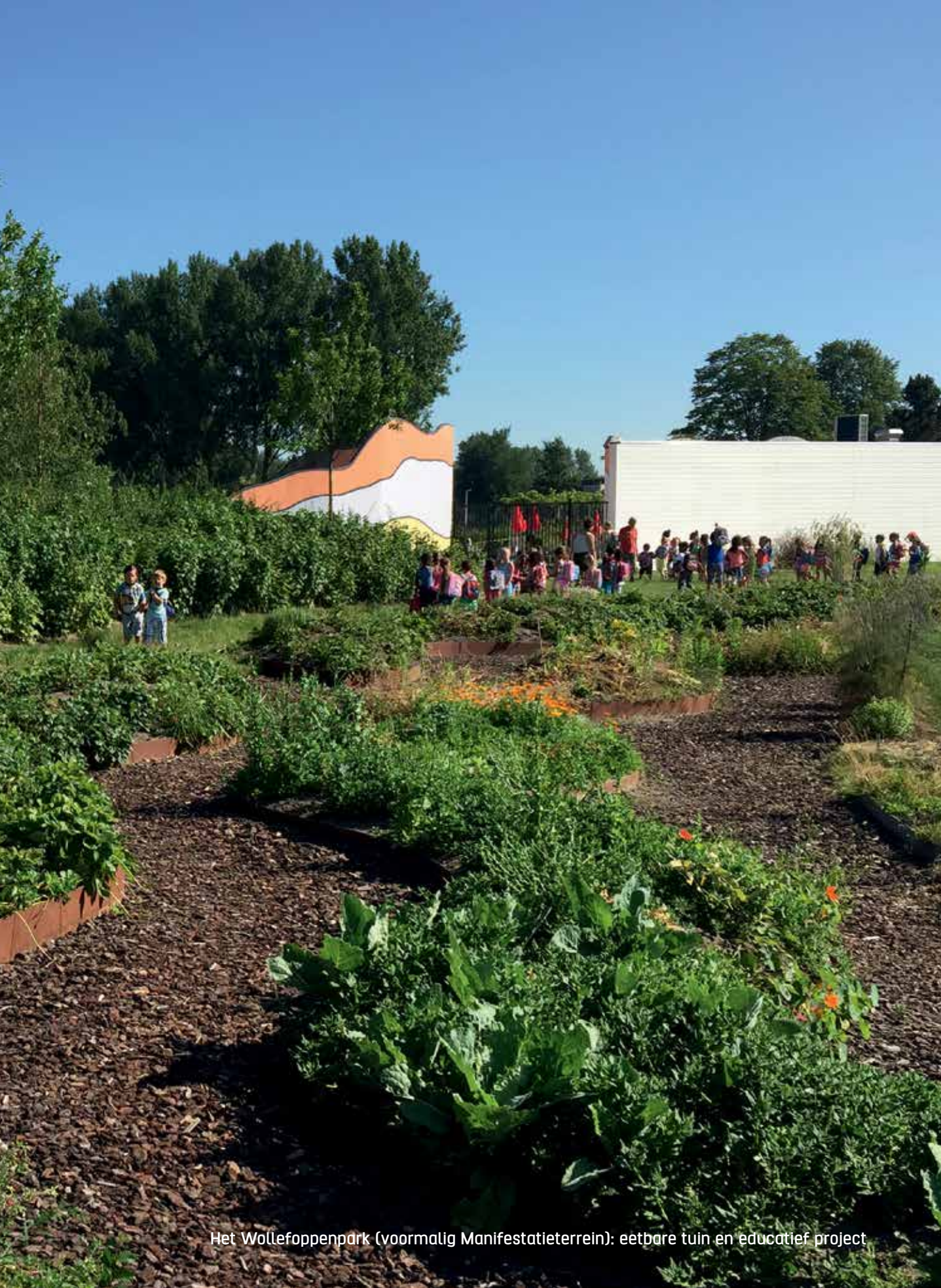
Het Wollefoopenpark (voormalig Manifestatieterrein): eetbare tuin en educatief project