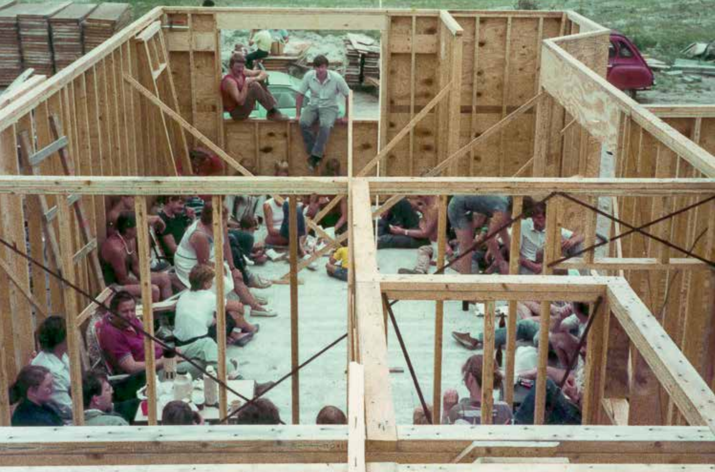
< A V De zelfbouwers van de Merenbuurt, ze waren één familie