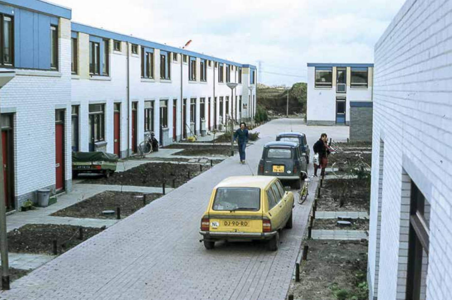
AV Van zand naar groene oase