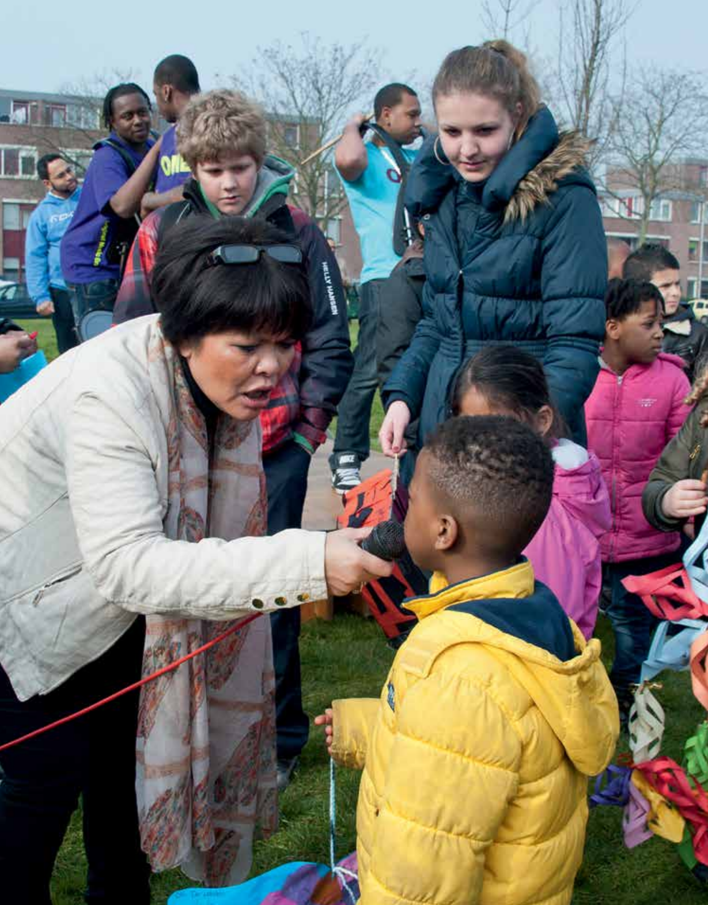
< A Door Faber trekt Scholendag in Wollefoffenpark