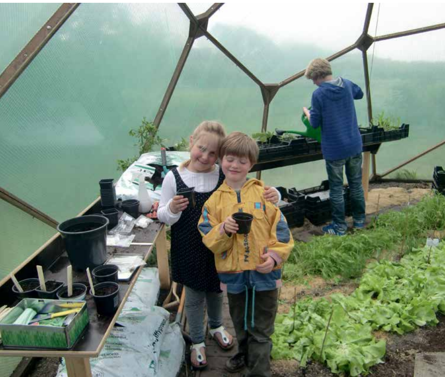
< ^ Wollefoppengroen bouwt serre in de boomgaard van Orion