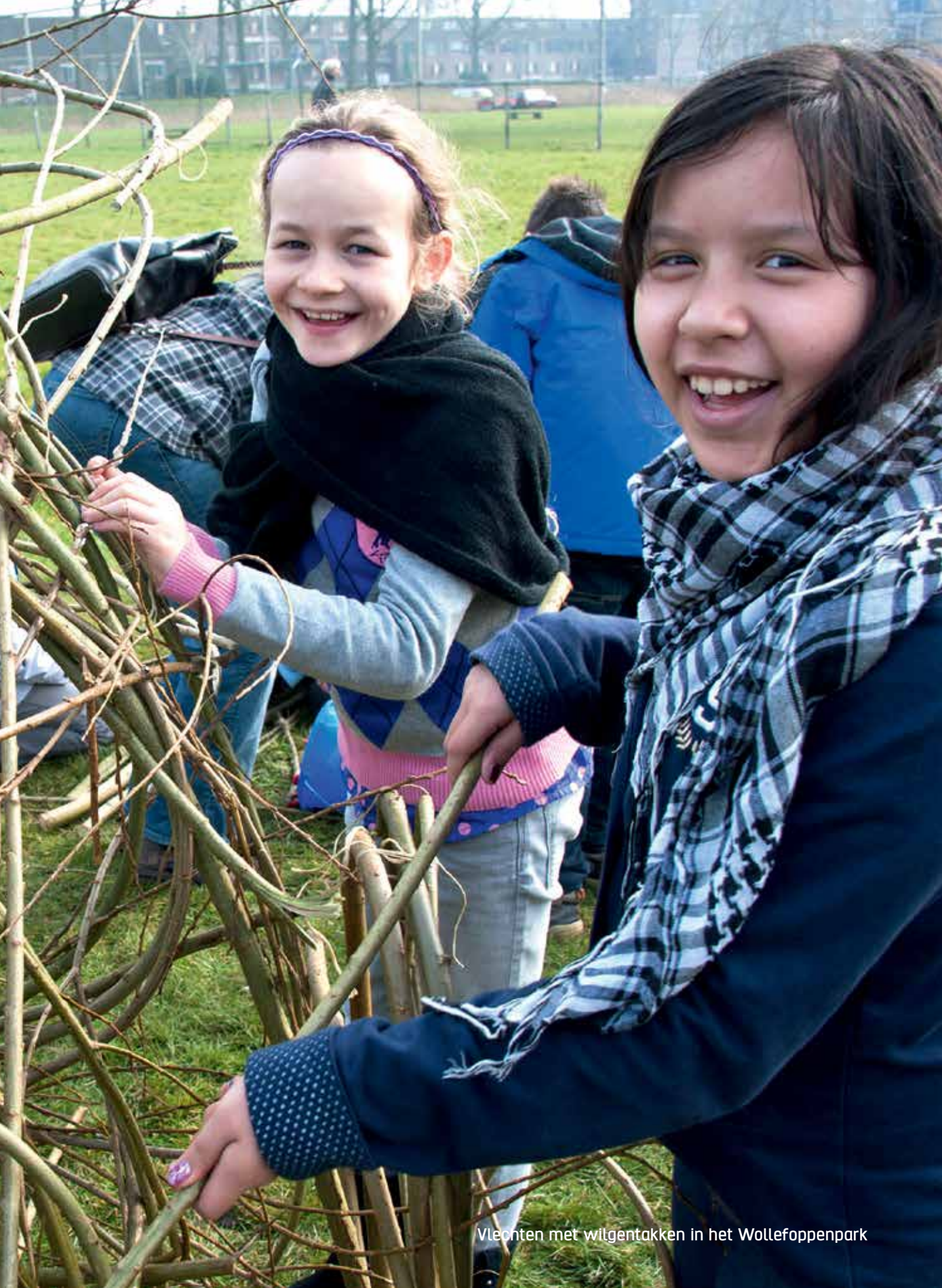
Vlechten met wilgentakken in het Wollefoopenpark