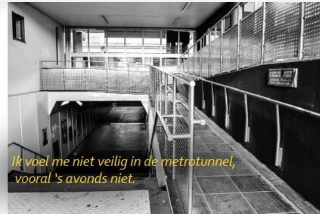
Ik voel me niet veilig in de metrotunnel, vooral 's avonds niet.