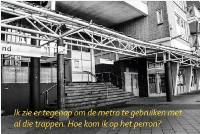
Ik zie er tegenop om de metro te gebruiken met al die trappen. Hoe kom ik op het perron?