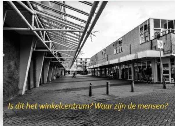
Is dit het winkelcentrum? Waar zijn de mensen?