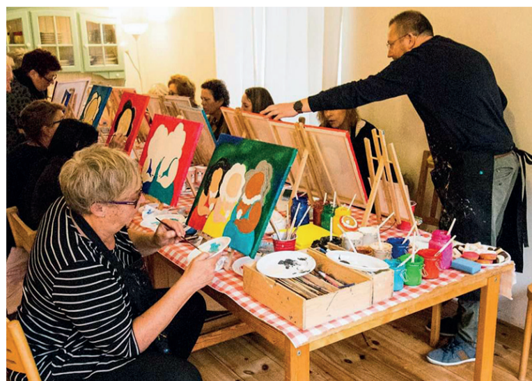
Het aanbieden van workshops