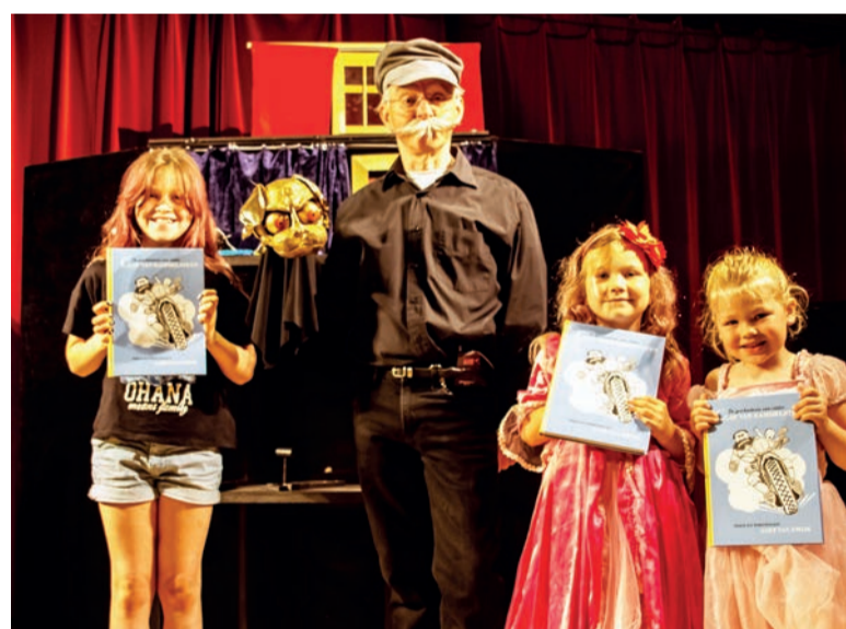
Het mogelijk maken van theatervoorstellingen voor kinderen