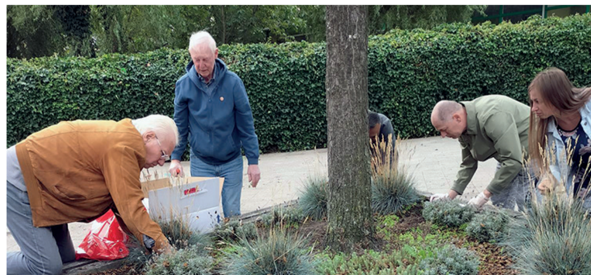
Het ondersteunen van bewonersinitiatieven