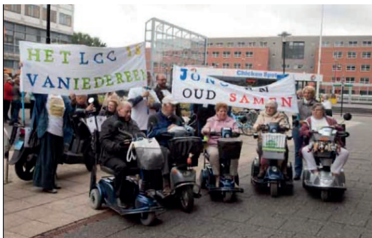
Protestactie op het plein voor de deelgemeente Prins Alexander