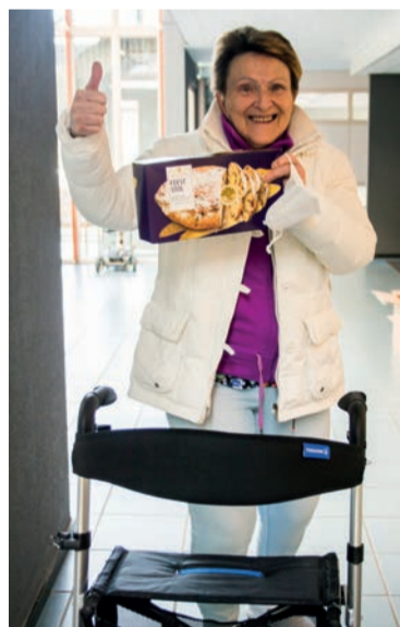
Contacten met senioren