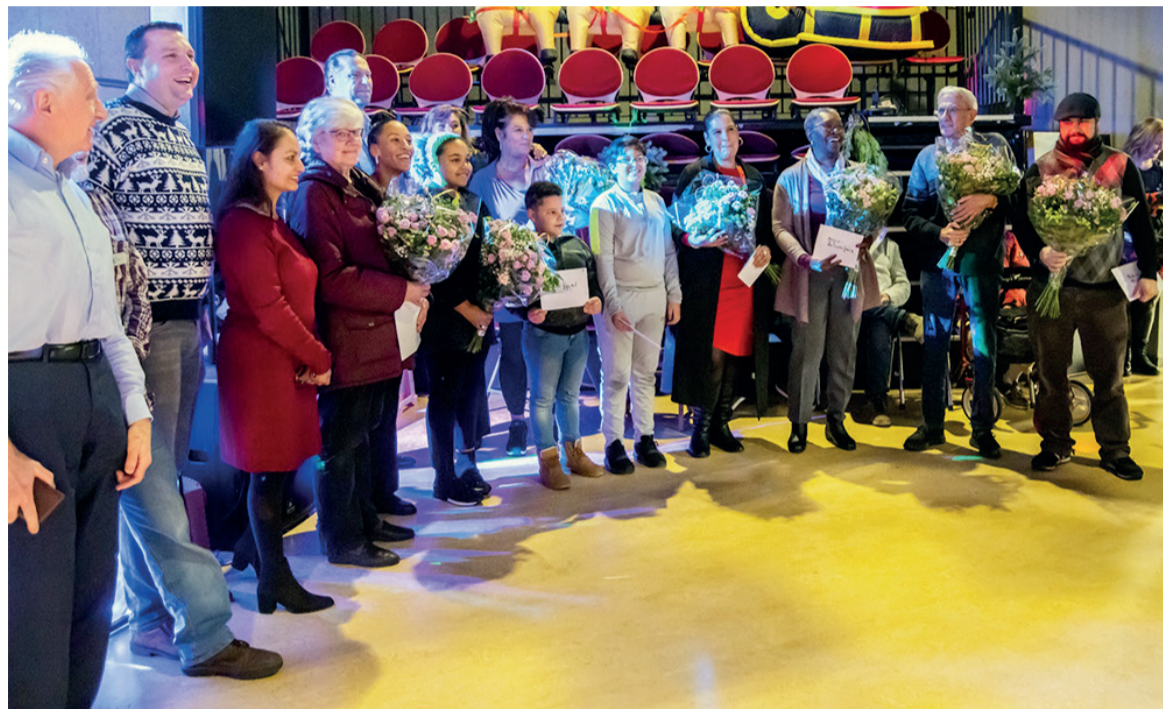
Winnaars en genomineerden ...