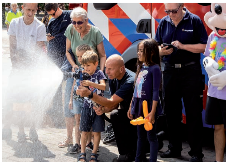
Het bieden van activiteiten op het Ambachtsplein

Voor het komende jaar 2024 plannen we activiteiten als Zomerse Zaterdag als vakantiebesteding en kindertheaters, mede aangedragen door Cultuur Concreet. Voor de senioren voorzien we een niet commerciële Pasar Malam, Gouwe Ouwe met muziek uit de 70er jaren, een pleinbioscoop met Abba, diverse theatervoorstellingen en spannende workshops. We trachten zoveel mogelijk aan te sluiten bij de doelgroepen. Via open podia geven we kans aan jongeren om hun talent te tonen.