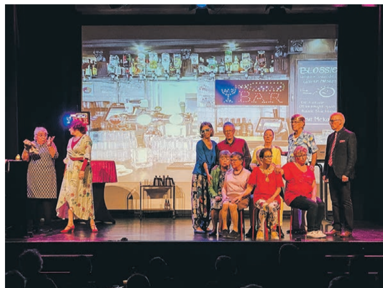
Het mogelijk maken van theatervoorstellingen