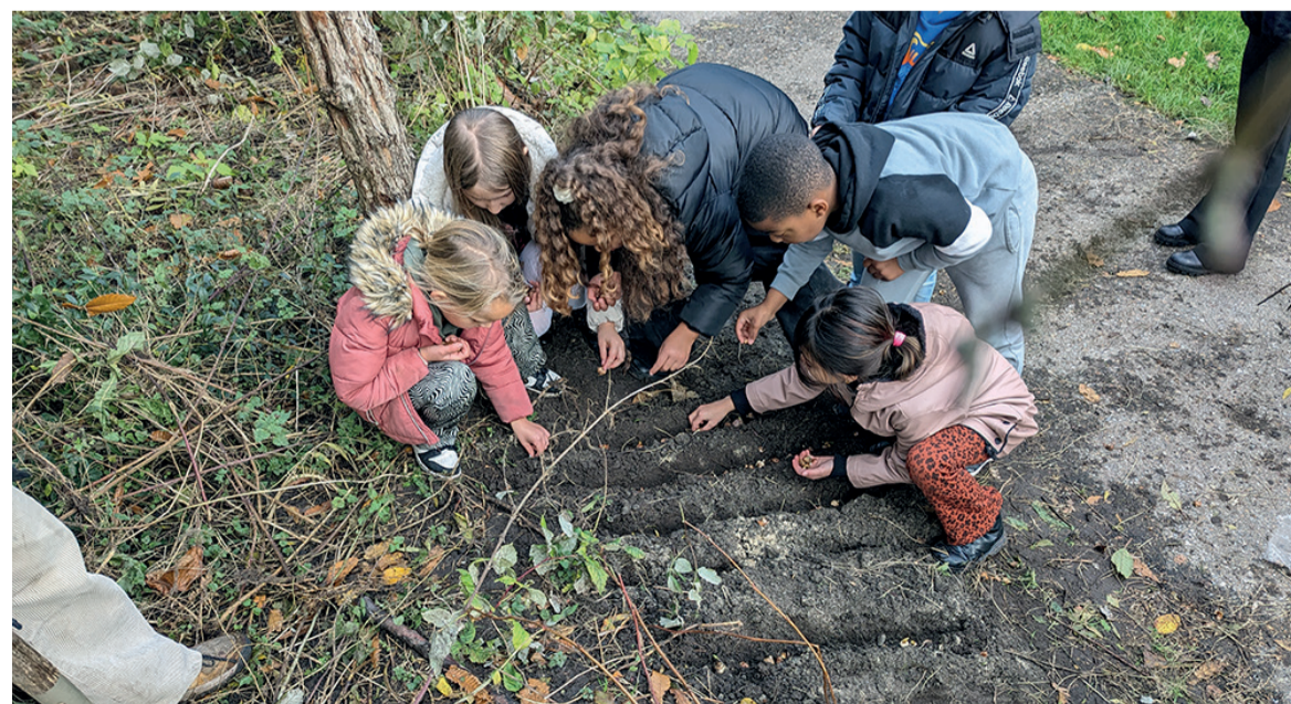
(Kinderen planten de bloembollen voor in het voorjaar)