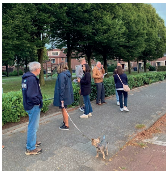
De wijkraad schouwt de buitenruimte

U kunt de wijkraad voor andere zaken bereiken op wijkraden@rotterdam.nl . Geef duidelijk aan dat het om de wijkraad van Zevenkamp gaat, indien u naar dit adres mailt.