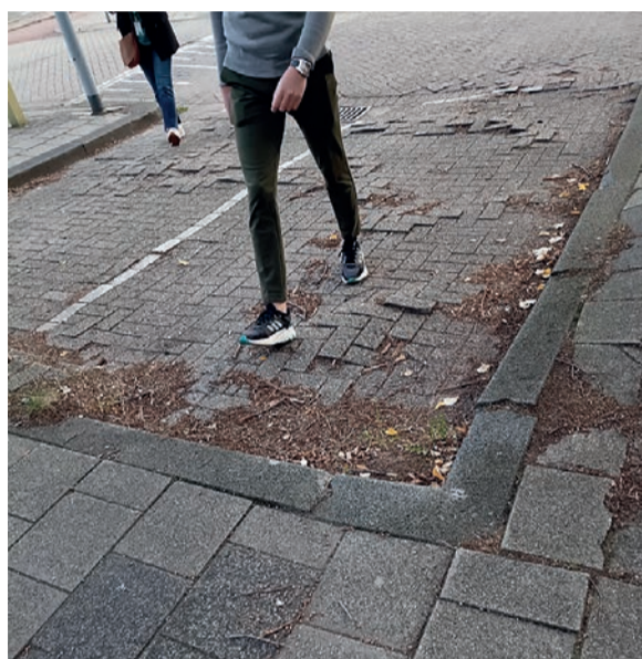
Losse en/of ongelijk liggende stenen