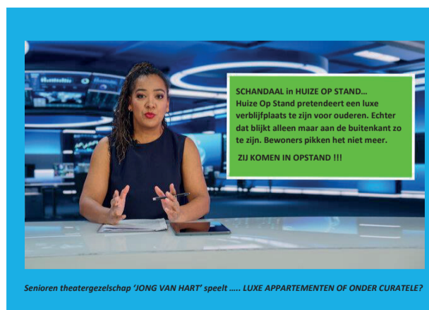
Senioren theatergezelschap 'JONG VAN HART' speelt .... LUXE APPARTEMENTEN OF ONDER CURATELE?

TRY OUT: Zondag 19 november 2023 Aanvang: 14.00 uur Entree: GRATIS Adres: Huis van de wijk Zevenkamp Ambachtsplein 141, 3068GV Rotterdam Reserveren: stichtingboz@outlook.com Telefoon: 06- 37563093