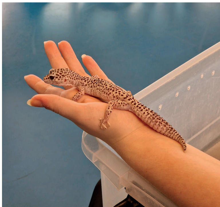
Ruby de luipaardgekko

Ben jij ook zo stoer en wil je wel eens weten hoe onze gezellige school er vanbinnen uitziet? Iedereen is altijd welkom voor een rondleiding of kennismakingsgesprek. U kunt contact opnemen met de directie via het telefoonnummer 010 421 4668. U kunt ook een mailtje sturen naar: info@kbsvliedberg.nl . Wie weet tot snel!