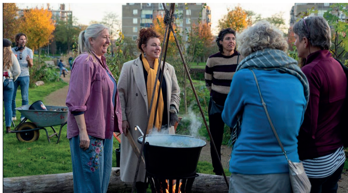
Vuurtje en soep Pollinators