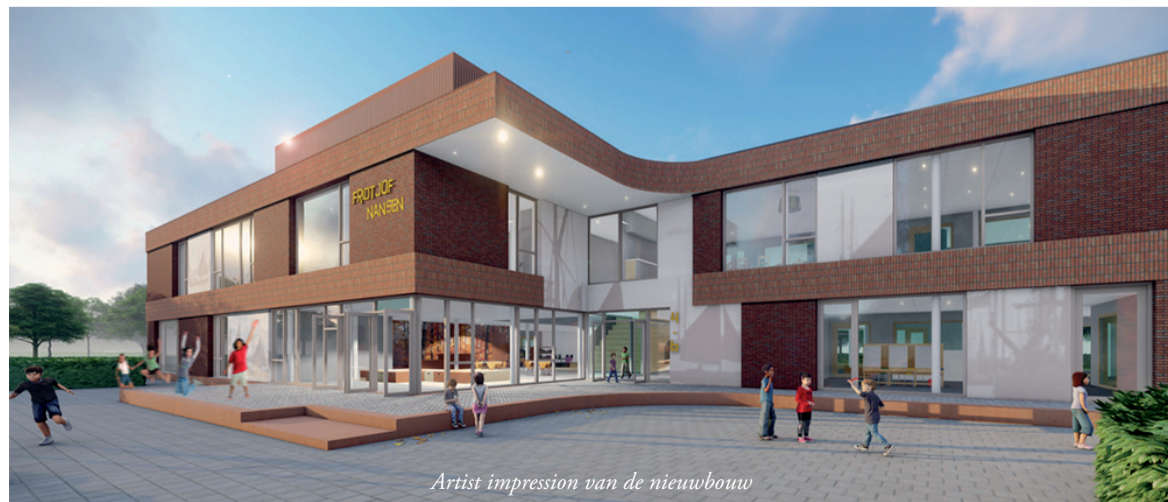
Artist impression van de nieuwbouw

Na een periode van ruim anderhalf jaar, vertrok OBS Fridtjof Nansen uit Zevenkamp terug naar Ommoord. Sinds januari 2021 hadden leerlingen en leerkrachten tijdelijk intrek genomen in een schoolpand aan de Jan Greshoffstraat / Dirk Costerstraat in Zevenkamp. De verhuizing was noodzakelijk omdat het oude schoolgebouw aan de Nansenplaats in Ommoord aan vernieuwing toe was en gesloopt werd. Na de sloop van het pand is de nieuwbouw gestart en heeft de oplevering in de zomer van 2022 plaatsgevonden. Na de schoolvakantie begint het nieuwe schooljaar in de nieuwbouw.