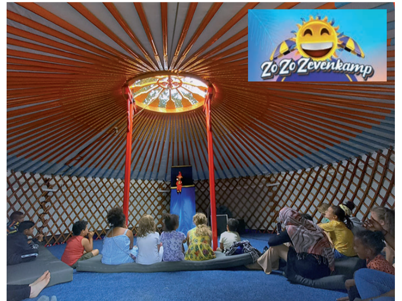
... Poppentheater ...

Ook tijdens de Zomerse Zondagen 'ZoZo Zevenkamp' hebben de mensen kunnen genieten van muziek, dans, poppentheater en allerlei leuke activiteiten.