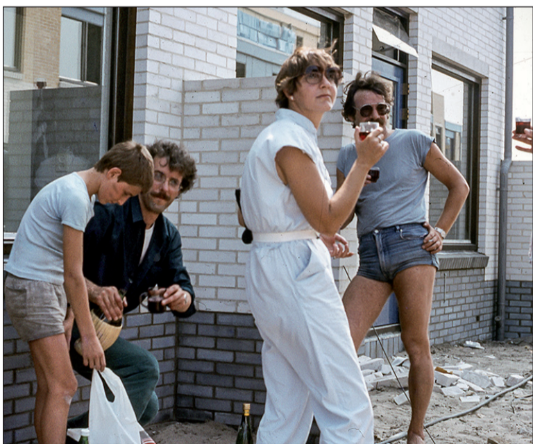
De eerste generatie bewoners ...

De toegang is gratis met dank aan de wijkraad die subsidie mogelijk maakte. Daardoor kunnen de bewoners van Centraal Wonen het lustrum met hun stadgenoten vieren. Centraal wonen ligt aan de Victor E. van Vrieslandstraat. De ingang is tussen nummer 35 en 39. Meer informatie staat op www.cw7.nl . Er is weinig parkeergelegenheid in de buurt. Van te voren aanmelden is niet nodig.