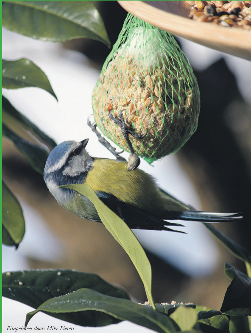
Pimpelmees door: Mike Pieters