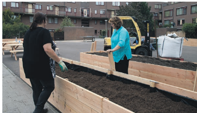
Voorbeelden van grotere en kleinere bewonersinitiatieven