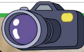
Kauw door: Mike Pieters