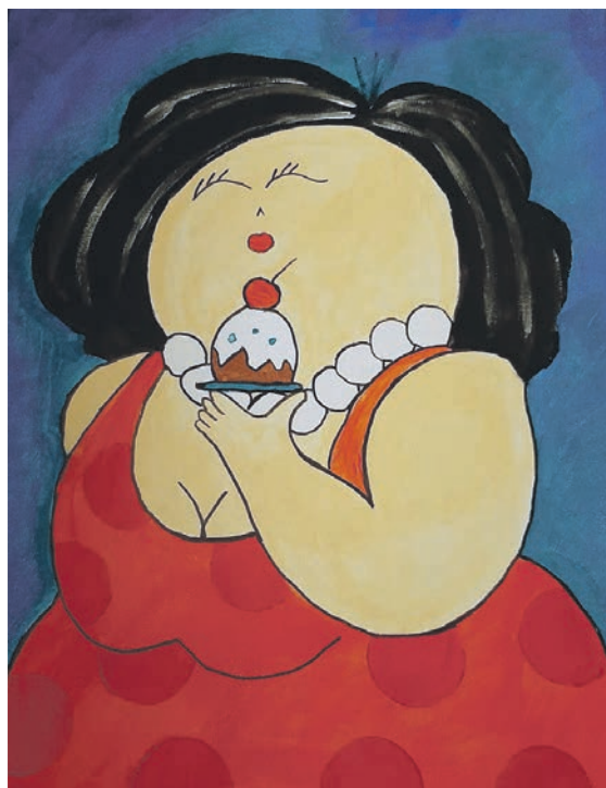
... en het eindresultaat...