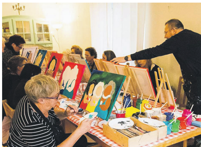
Workshop Dikke Dames schilderen...

De BOZ legt de laatste hand aan een cultureel programma in 2022 dat wordt gesponsord door Cultuur Concreet en fondsen. Hier volgt een voorlopige agenda, exacte datums zijn nog niet vastgelegd (zie pagina 7).