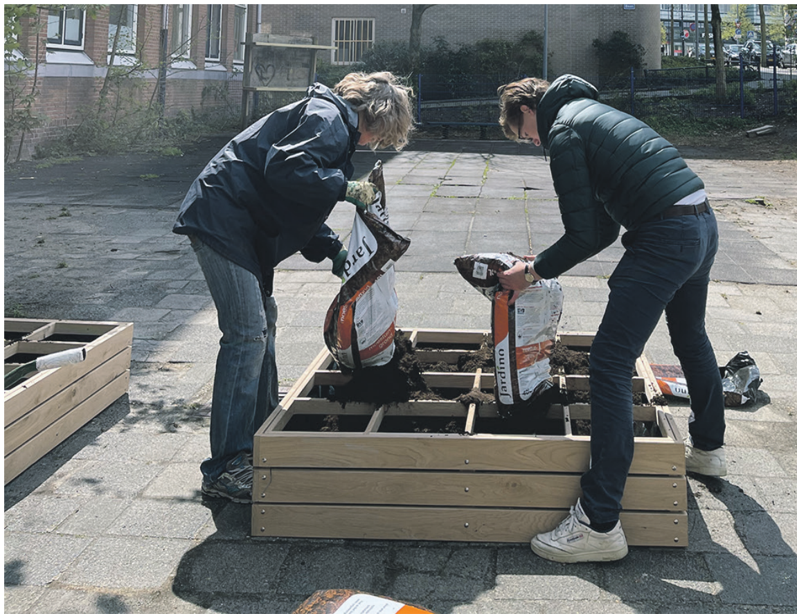
Voorbeeld van de moestuintjes

De moestuintjes bij de basisschool Klein Rotterdam worden in maart aangelegd en ingezaaid. Om dit te realiseren dient eerst een partij verwilderde struiken door vrijwilligers verwijderd te worden. Er komen ook veldjes met bloemen en planten die door leraren en kinderen en ouders worden geplant en onderhouden.