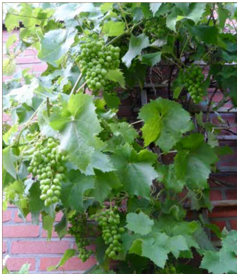
Druiven groeien ook zeer goed in Zevenkamp.