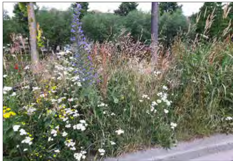
Welkomstkleurenpracht langs fietspad Zevenkampse Weg geeft vrolijkheid.

Uw oplossing vóór 1 september 2018 inleveren bij de BOZ/WIP, Ambachtsplein 141 - Rotterdam of stichtingboz@outlook.com