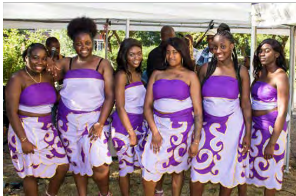
De foto van de week in de Havenloods was deze keer van onze eigen fotograaf: Kees Bosman!!