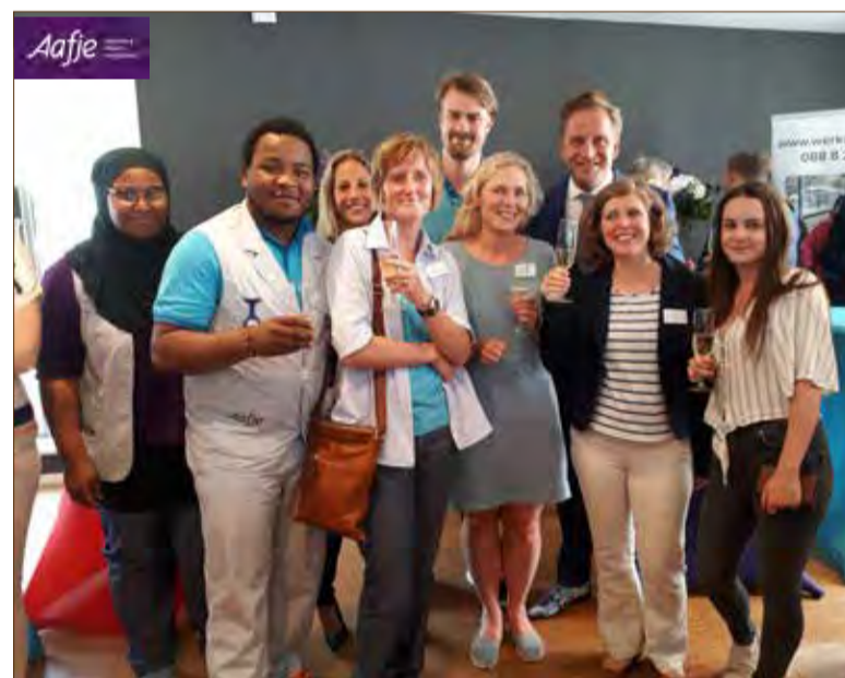
Aafje wijkverpleegkundigen met ketenpartners en minister De Jonge.

Tijdens de feestelijk bijeenkomst ging de minister in gesprek met wijkverpleegkundigen van Aafje aan de hand van door hen ingebrachte cases. Hierbij bleek dat goede samenwerking met ketenpartners, die ook aanwezig waren, om passende zorg op het juiste moment op de juiste plaats te krijgen ontzettend belangrijk is. Minister de Jonge was zeer geïnteresseerd en onder de indruk van de professionele en deskundige aanpak van alle betrokkenen. Hij benadrukte dat dergelijke samenwerking in de toekomst alleen maar zal toenemen en dat dit een goede ontwikkeling is. Na het ondertekenen van het akkoord nam de minister nog ruim de tijd om met de Aafje medewerkers en ketenpartners na te praten over hun boeiende vak.