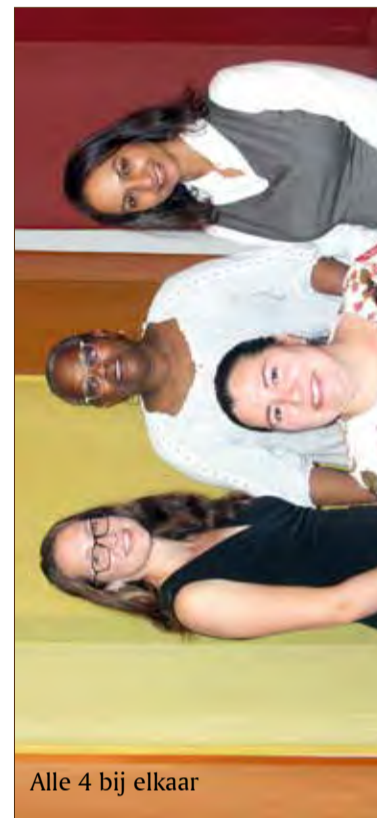
Alle 4 bij elkaar

Waarom ja tegen deze functie? Ik heb Ja gezegd tegen deze functie omdat dit een hele mooie kans is om te leren wat er in de wijk speelt. Ik wil graag weten wat de bewoners willen, zodat we de wijk nog beter kunnen maken.