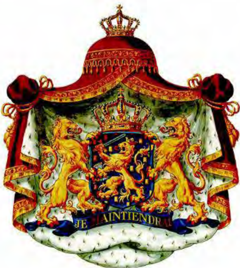
Boven: tekst op het Koningswapen: 'Je maintiendrai la vertu et noblesse.' Rechts: De Gouden Koets