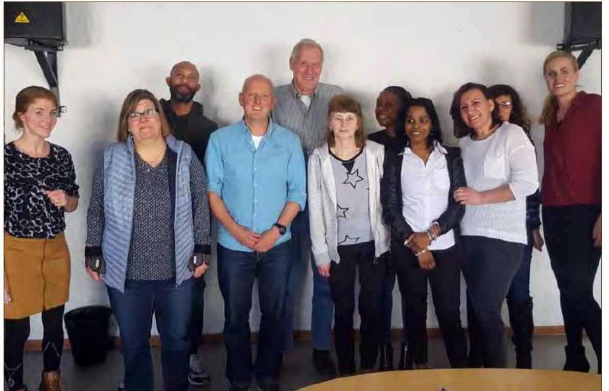
De trainingsruimte in het buurthuis.