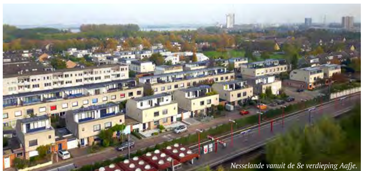
Nesselande vanuit de 8e verdieping Aafje.