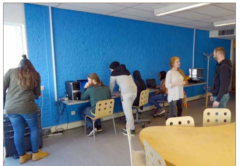
De trainingsruimte in het buurthuis.