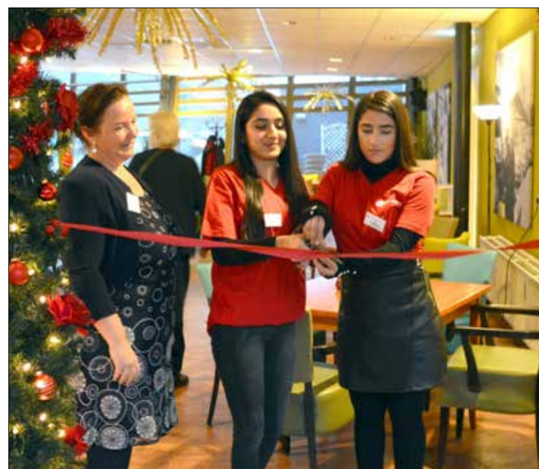
Studenten open het Wijkleerbedrijf met het doorknippen van een lint.

Wilt u meer informatie over het Wijkleerbedrijf? Neemt u dan contact op met één van de coördinatoren van het Wijkleerbedrijf. Dit kan telefonisch via ☎ 06 - 41172473 of via een email aan alexander-ommoord@wijkleerbedrijf.nl .