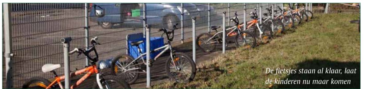
De fietsjes staan al klaar, laat de kinderen nu maar komen