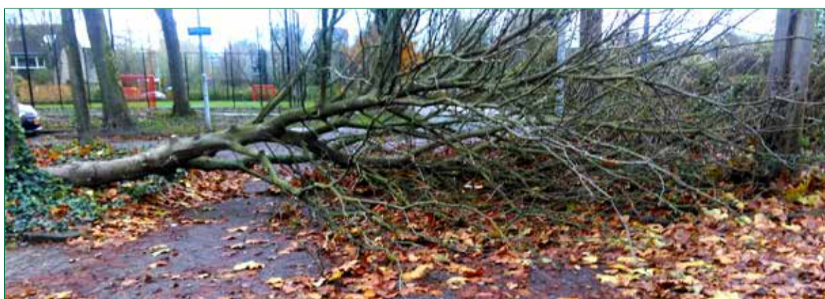
Een van onze trouwe lezers en rasechte Zevenkamper Frans Bracht maakte deze foto.