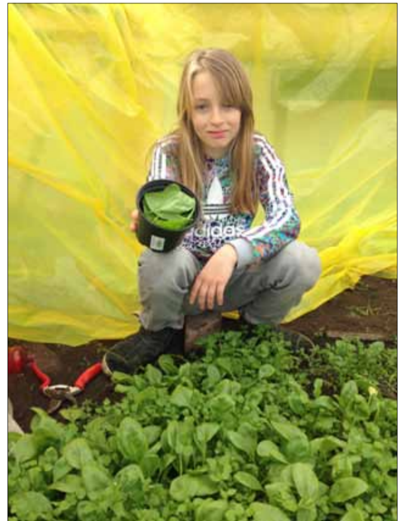
Wollefoppengroen in het groen