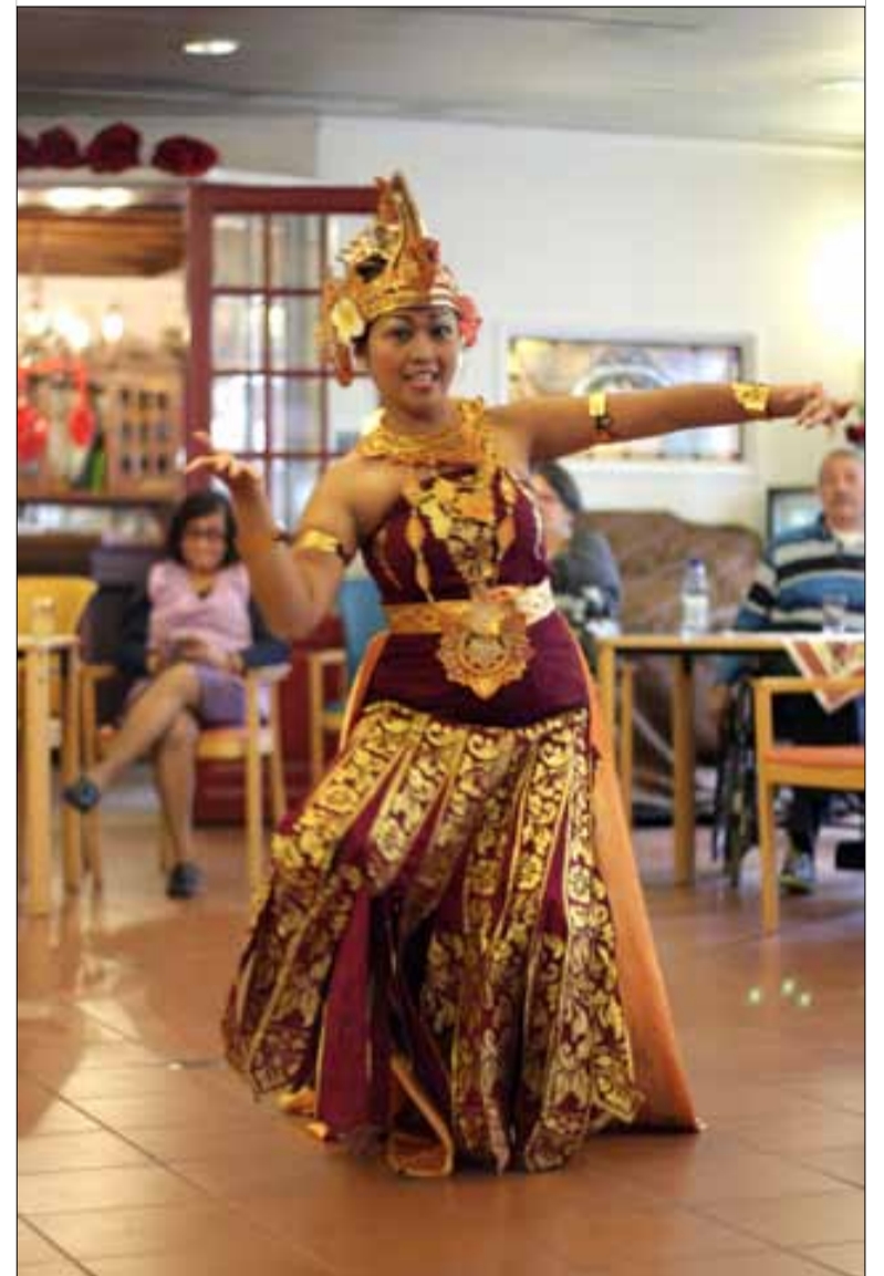
Dansen in de Vijf Havens