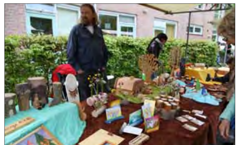
Hemelvaartsmarkt in Orion