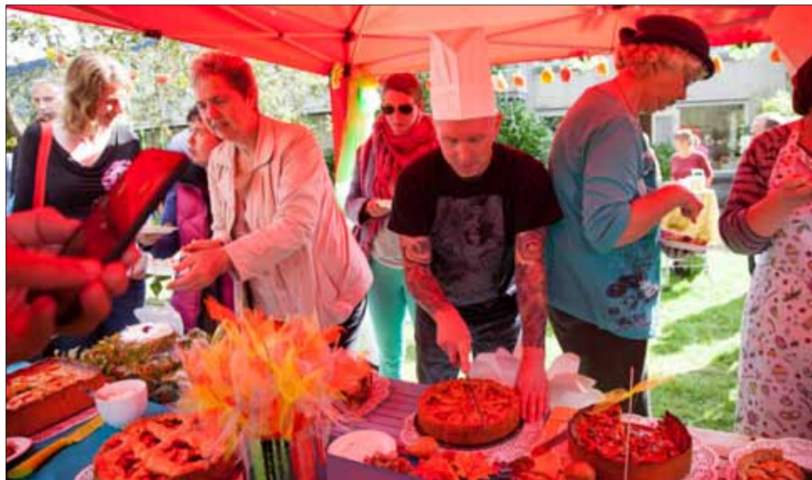
'Centraal Wonen 7kamp vierde Burendag wederom met het zeer geslaagde Appelfestival' "Onder het motto 'Heel CeeWee Bakt', was er een appeltaartbak-wedstrijd, waar de koks en de vele proevers zeer van genoten hebben! Volgend jaar weer!"