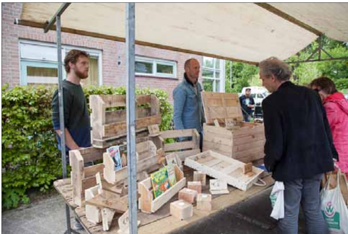
Meer foto's kunt u bekijken op www.zevenkamp.info onder de knop Bewonersorganisatie Zevenkamp

De Hemelvaartsmarkt vindt ieder jaar plaats op de in het groen gelegen werkplaatsenlocatie 'de Pleiaden' aan de Wollefoopenweg. Bij deze werkplaatsen worden kwalitatief duurzame en ambachtelijke producten gemaakt. Cliënten leren hier een ambachtelijk vak en kunnen zo op hun eigen manier een bijdrage leveren aan de samenleving.