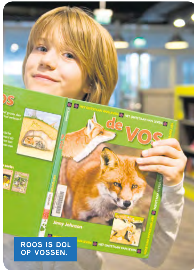
ROOS IS DOL OP VOSSEN.