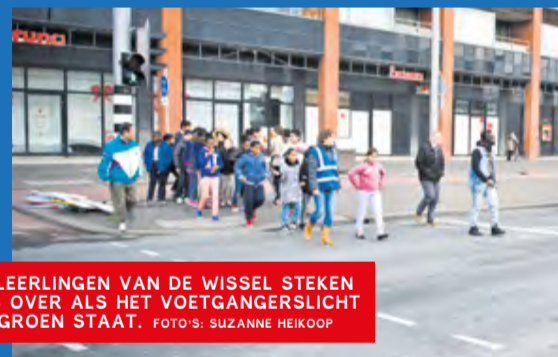
DE LEERLINGEN VAN DE WISSEL STEKEN PAS OVER ALS HET VOETGANGERSLICHT OP GROEN STAAT.

FEIJENOORD – Bij een ongeluk op de Laan op Zuid is op 22 september een jongen van 7 jaar omgekomen. De stoplichten op de plaats waar hij samen met zijn zusje en moeder overstak, werkten niet. Op het moment dat zij met hun fiets overstaken, begonnen ook de auto's weer te rijden. De jongen kwam onder een vrachtwagen terecht. TEKST: SHARON VAN OOST