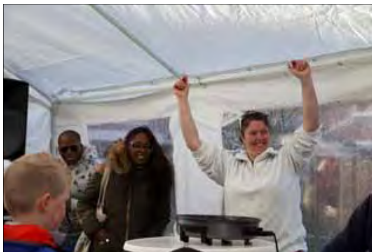
De hele speelplek bij Spinet-Blokfluit schoonmaken, de voortuintjes opknappen en dan lekker smullen. Enthousiaste vrijwilligers en kids kregen het weer voor elkaar. Hoogtepunt werd het muzikale swingen en de Karaoke. Ze hebben het bijzonder naar hun zin. NLdoet verbindt.