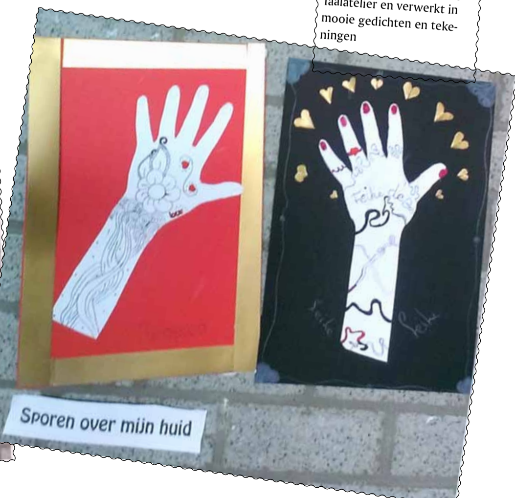
Sporen over mijn huid