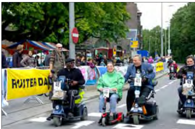
De scootmobiel is een heuse vereniging geworden. Succes!